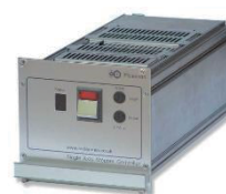
ステッパモータコントローラ