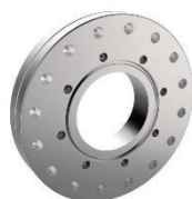
ゼロレンクス変換フランジ