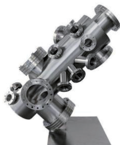
前処理、試料移動チェンバー