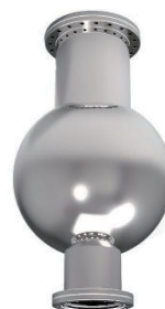
球形チェンバー（ポート設計可）